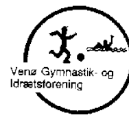
Venø Gymnastik- og Idrætsforening